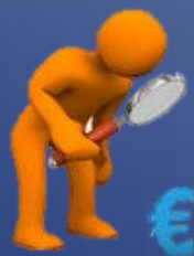
Табл. 2 – Внесени за одобрение проекти